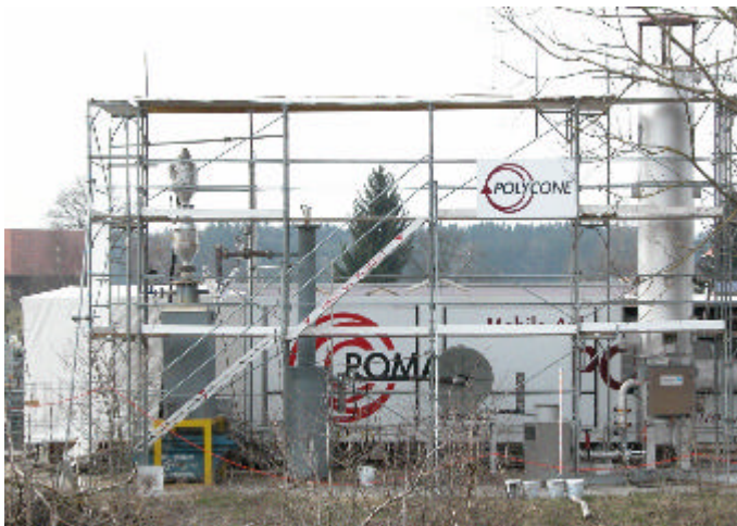
Pilotanlage in Hindelbank

Diese arbeitet nach dem System „Hofstetter“. Hier werden die vom HTV anfallenden Schwachgase umweltgerecht verbrannt und in Heizenergie umgewandelt. Zudem kann der vom Schlammrocknungsprozess anfallende Brügendampf mitverbrannt werden.